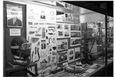
Exposition consacrée à l'Aérodrome de Tantonville

- Enfin, la dernière est consacrée à l'aérodrome de Tantonville, afin de préparer l'inauguration à Omelmont, le 22 septembre prochain d'une plaque dédiée à Bradley Clark, pilote du 371st Fighter Group tombé au retour d'une mission le 23 décembre 1944.