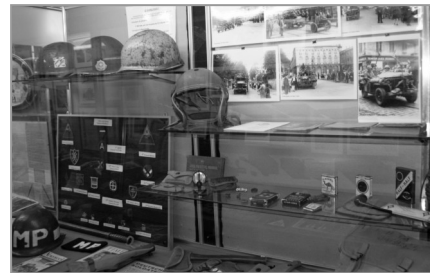
La Libération de Nancy, complément de l'exposition présentée au Musée Lorrain

- La troisième aborde la libération de Nancy en complément de l'exposition du musée Lorrain consacrée à Jean Prouvé, maire de Nancy à la libération. L'association ayant été sollicitée pour prêter quelques photos et objets de l'époque.