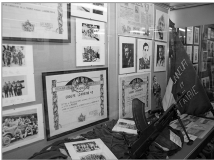
Vitrine consacrée au Groupe Lorraine 42